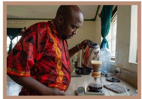
Vom Regionallager zur Zentrale zum Verkosten & exportfähig verpacken