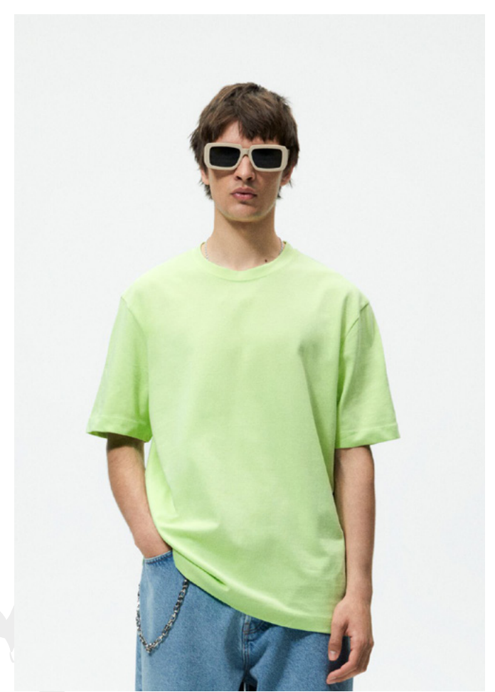
T-SHIRT EINER GROSSEN MODEKETTE