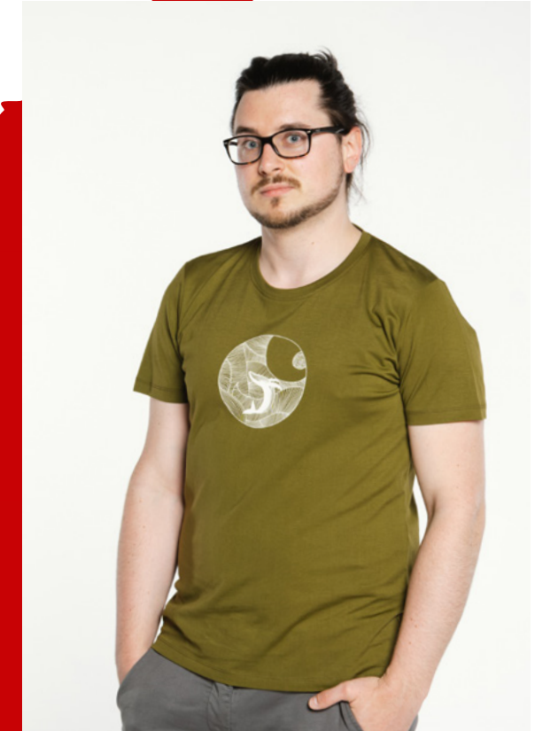
T-SHIRT BY ANUKOO